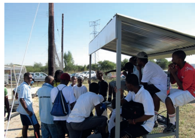
Brenninkmeijer en De Vries bezochten veertien scholen door heel Botswana.